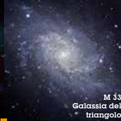
M 33 Galassia del triangolo