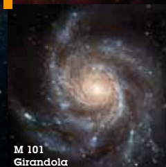
M 101 Girandola