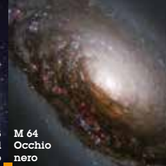
M 64 Occhio nero