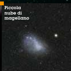
Piccola nube di magellano