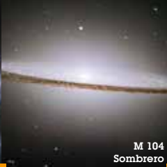
M 104 Sombbrero